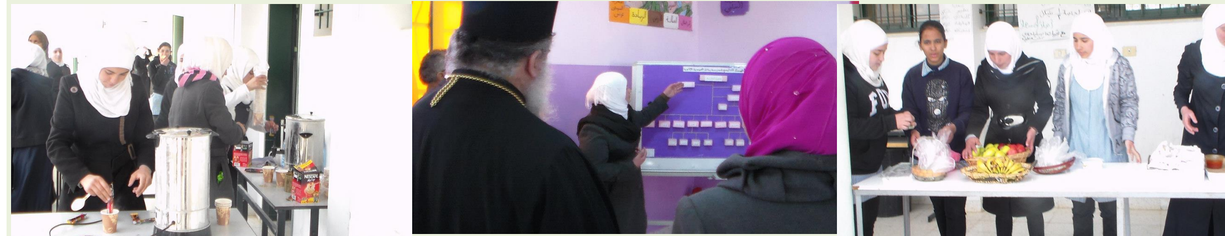
أولياء الأمور والمؤسسات المحلية

وجاءت الفكرة إنها الأنشطة اللاصفية المساندة ولكن كيف؟؟؟؟؟؟؟؟؟؟؟؟؟؟؟؟؟؟؟؟؟؟؟؟؟؟؟؟؟؟؟؟ توظيف التعلم بالمشاريع من خلال تحويل جميع المصطلحات إلى أنشطة لاصفية تشارك فيها: جميع الطالبات